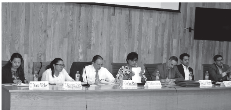
Presidium de la Mesa 2 “Tendencias actuales de la Administración Pública” .