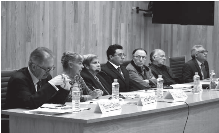
Presidium de la Mesa 1 “60 Años de Historia de la Administración Pública en la UNAM” .