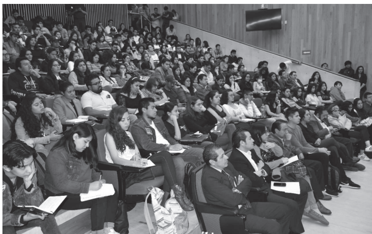
60 Aniversario de la Carrera en Administración Pública en la Facultad de Ciencias Políticas y Sociales