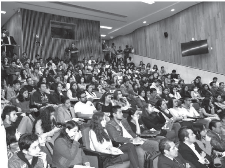
60 Aniversario de la Carrera en Administración Pública en la Facultad de Ciencias Políticas y Sociales.